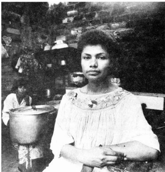
María Elena Moyano en Villa El Salvador