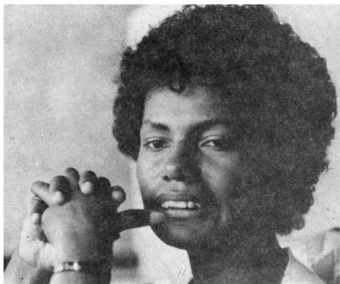
María Elena Moyano