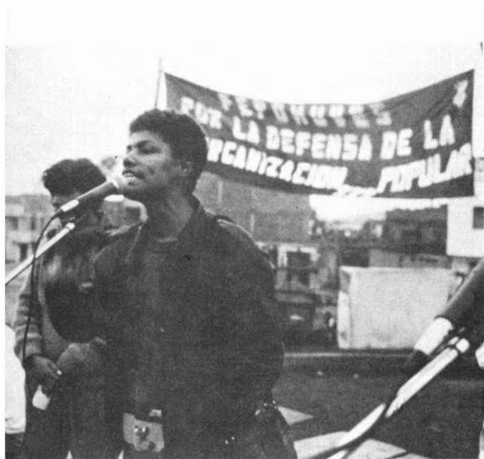
Mitin de la FEPOMUVES.