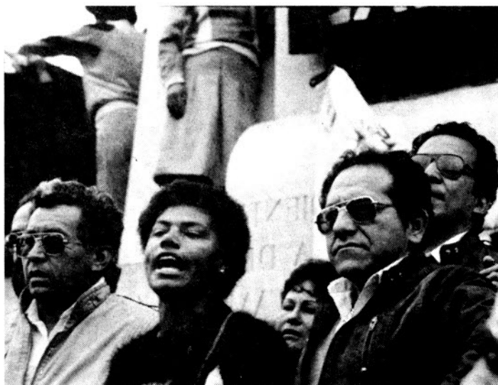
Manifestación en la Plaza San Martín